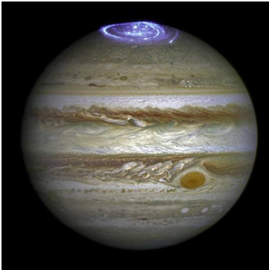
Jupiter (Zeus/Osiris) met Aurora ofwel Aureool op Het Hoofd van de Konings Planeet

Kortom we bevinden ons in twee UNIEKE jaren welke pas weer als celestiale configuratie over 49 jaar terugkomen. Over 49 jaar is De Laatste Generatie echter, zoals voorspeld in de Bijbel (Mattheus 24:32-34 KJV), niet meer op deze aarde. Dus zal het een en ander volgens het filmscript van de gevallenen in de jaren 2016-2017 in vervulling moeten gaan om er zelf nog bij te kunnen zijn. De jaren 2016-2017 zijn dan ook zowel Celestiaal, Bijbels en Profetisch UNIEK in de geschiedenis van de (gevallen) engelen. U als Wakker geworden Mens is echter allang voor deze gebeurtenissen Opgestaan en Weer Naar Huis Gegaan in Rapture 1 of 2. Kortom U Bent Out Of Time!