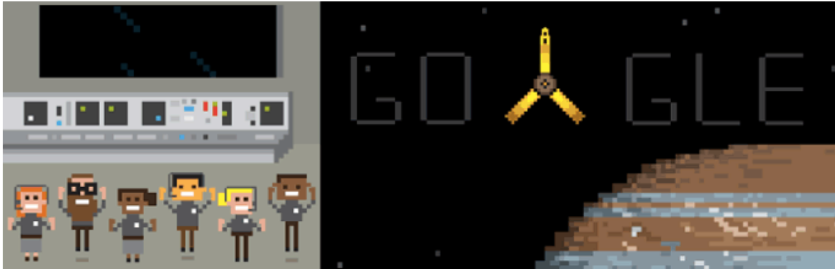
Google Doodle 4 juli 2016 waar Juno/Hera (YOD) bij Jupiter/Zeus is

Het is dan ook niet toevallig dat op 4 juli (Amerikaanse Independence Day) de NASA Probe genaamd Juno (Romeins) Godin Moeder van De Hemel/Sky - ook wel Hera (Grieks) en Sophia (Oorspronkelijke Wereld) genoemd - arriveert bij Jupiter (Romeins) - ook wel Zeus (Grieks) genoemd - en Jupiter omgeven wordt door een Aurora boven op het Hoofd van de planeet alsof deze (schijn)heilig is. Jupiter staat echter voor de valse profeet, 66 en het begin van de polariteit ofwel gevallen schepping in de zielenwerelden (1 e Val).